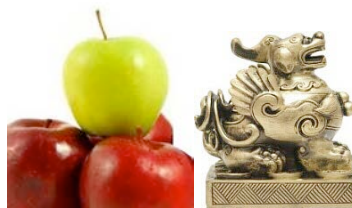
Piyao o Pixou con sus manzanas

Activar el piyao – con incienso abrirle sus ojos para que lo reconozca como su dueño, y colocarle cuatro manzanas (formando una pirámide) para que esté contento.