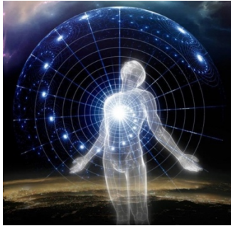
Vela por tu iluminación

Esto significa velar tu iluminación, haciendo que tus intenciones sean correctas a pesar de las dificultades internas.