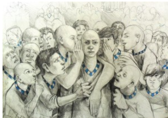
No juzgues y que no te afecten los juicios de los demás

Desapégate de los juicios de y hacia los demás..... Solo así podrás transitar esta época de una manera positiva.