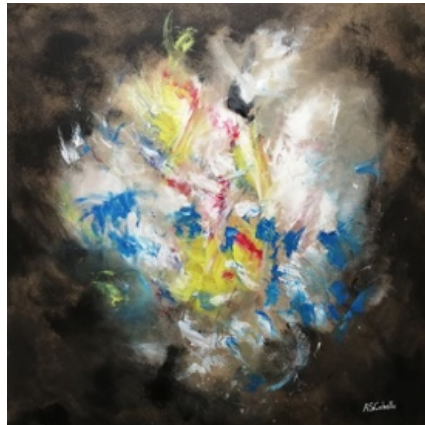
Luminosidad – Autor de la Pintura: Antonio Sánchez Cabello

El sol se ha ocultado debajo de la tierra, la luz herida. Bello y claro en el interior; flexible y obediente en el exterior, rodeado de adversidad.