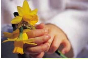
Nuestras mentes tienen el poder de curar el dolor.

“Hay dos elementos consistentes en esta práctica: la repetición de un sonido y descartar los pensamientos negativos”.