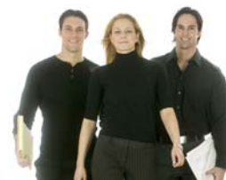
Cada uno de nosotros puede ser considerado un universo.

"Shan" también incluye el "Qi Gong", la práctica que apunta a construir un cuerpo saludable que usa el qi apropiado para que este fluya en el cuerpo.