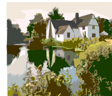
La casa conviene esté rodeada de los cuatro animales celestiales.

Por esto es sumamente importante que al buscar una casa u oficina, o un local para poner un negocio, se observe bien el entorno y se considere primero este aspecto.