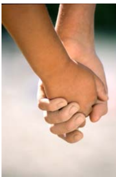
Todo está vinculado a como vemos y recibimos la vida.

Al verbalizar pensamientos derrotistas e irracionales, estamos enviando un mensaje que impacta nuestro comportamiento, resquebrajando nuestra salud mental y física. Al enfocarnos en algo que no deseamos, allí experimentamos esa imagen que con el tiempo nos impulsará a convertirla en nuestra realidad, aunque el resultado sea lo contrario a lo que buscamos. Claro, en la mayoría de los casos esto sucede en el inconsciente, donde la imagen creada así adquiere autonomía.