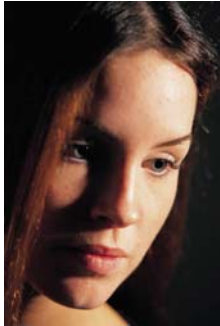
El apego se extiende a las opiniones y creencias.

E n un nivel muy profundo, sufrimiento es el apego desmedido que hemos desarrollado hacia este cuerpo y esta mente, con sus cogniciones, percepciones, sensaciones y reacciones.