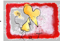
Observa lo que comes.

Las malas noticias es que las peleas con tu pareja serán frecuentes. Esto será especialmente cierto para las Ratas casadas y que nacieron en 1960 o en 1972. Sé más comunicativo con tu pareja. El o ella necesita cuidados y comprensión.