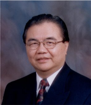
Master Joseph Yu, la máxima autoridad de Feng Shui Clásico en el mundo.

Las energías del Universo nos afectan en todo momento.