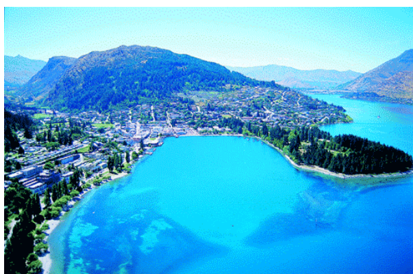
Foto no. 1—Primeramente, en el Feng Shui la ubicación ideal tiene una montaña atrás y agua adelante.

Con bisel en chapa de oro para colgarse a una cadenita de oro. Código C0002