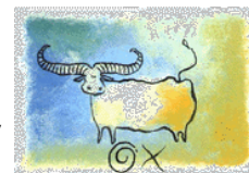
No especules ni apuestas.

Por lo tanto, ten cuidado con gastar de más y cuida tu cartera, ya que otras personas pueden querer robártela. Los meses de agosto y septiembre serán los más inauspiciosos para el Buey. No especules ni apuestas.