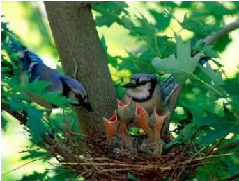
La Primavera está representada por el elemento Madera.

A cada estación le corresponde un Elemento, un Sentido, un Sabor, una Dirección, un Clima, dos Organos, etc.