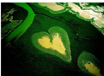
Las hojas y las flores estallan en las ramas para regalarnos el color VERDE.

A cada estación le corresponde un Elemento, un Sentido, un Sabor, una Dirección, un Clima, dos Organos, etc.