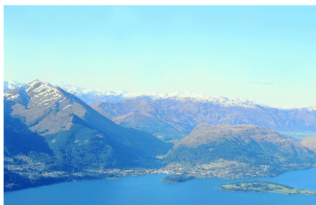
Foto no. 2—La otra forma auspiciosa de Queenstown es una pequeña 'isla' enfrente del centro del pueblo.

Es raro encontrar un sitio tan maravilloso, y vemos que otras ciudades exitosas en el mundo tienen este tipo de configuración de 'silla', como Hong Kong, Río De Janeiro, Nápoles (Italia) y Sydney.