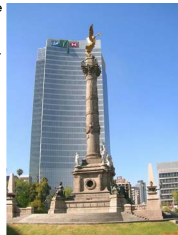
El edificio de HSBC está ubicado frente a una de las glorietas más hermosas de la Cd. de México.

"Nuestro legado bancario es muy importante para nosotros, pero también sentimos que este