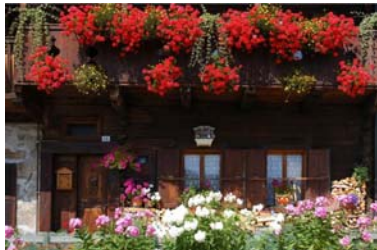
El Qi como influencia direccional - medioambiental - se acercará a una estructura construida de afuera hacia adentro.

funcionará como una base para llegar al Mapa de Dragón de Agua.