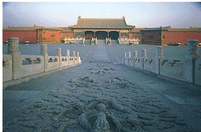
El Palacio cubre una superficie de más de 720.000 metros cuadrados, y posee más de 9.000 habitaciones.

Se ha conservado la disposición original a pesar de las repetidas reconstrucciones y ampliaciones durante las dinastías Ming y Qing.