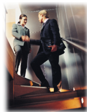
La sociedad es un elemento vivo de la vida, ya que ésta cambia y se modifica continuamente.