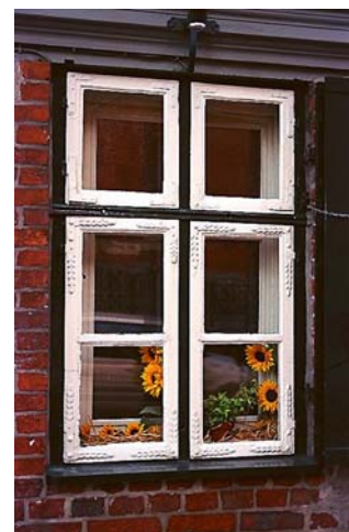
A través del Feng Shui, estudiamos el Qi medioambiental.

de Feng Shui necesitan ser aplicados principalmente al entorno, contrariamente a todas las curas interiores que hemos visto que han surgido en tiempos recientes.