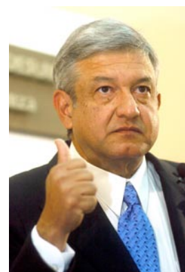
A Andrés Manuel la gente del pueblo y los viejitos lo adoran pues lo ven como su salvador.

Asimismo, estamos en año Perro, y Andrés Manuel tiene Dragón en su pilar del día, que lo representa a él y a su trabajo, y el día 2 es Dragón. Los choques de Ramas Tierra pueden ser amistosos, pero también pueden traer complicaciones y contratiempos. Esto hace a ese día el más desfavorable del año, en general, para todo mundo. Esperemos que no sea así, por nuestro bien.